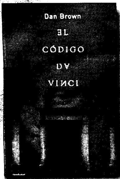
'El Código Da Vinci'.

E l que en estos momentos sea, junto a El caballero de jubón amarillo , la obra más vendida en España merece un respeto. Y también lo merece el hecho de haber sido una de las novelas más leídas en el mundo anglosajón. Algo tendrá el agua cuando la bendicen. Luego veremos si esa agua pertenece a un río sagrado o ha sido extraída de cualquier acequia. Para empezar, lo que está claro es que El código Da Vinci es un libro que atrapa desde la primera página. Con una acción trepidante, bien planteada. Y con sus buenos y sus malos. Su chico y su chica que al final de enamoran, como está mandado. Dan Brown , el autor de estas páginas, sabe, además, administrar la acción. Sabe en qué momento hay que incluir en la obra un nuevo suceso, un enigma que es necesario resolver. Y por si todo ello fuera poco, recurre al morbo de añadir entre los malos a miembros pertenecientes al Opus Dei, sacando a relucir sus relaciones con la Banca Vaticana y sus influencias en la Curia Romana. Dinero y disciplina por doquier. Maletines repletos de pasta, y no precisamente de trigo, y cilicios capaces de rasgar el muslo más prieto y musculado. La obra se lee de un tirón, pero, analizada en profundidad, resulta decepcionante por varias razones. En primer lugar, porque el final de la misma está prendido con alfileres. El público norteamericano, que es joven, apasionado y aguerido, podrá caer en la trampa, pero nosotros, los europeos, tenemos quince siglos de literatura a